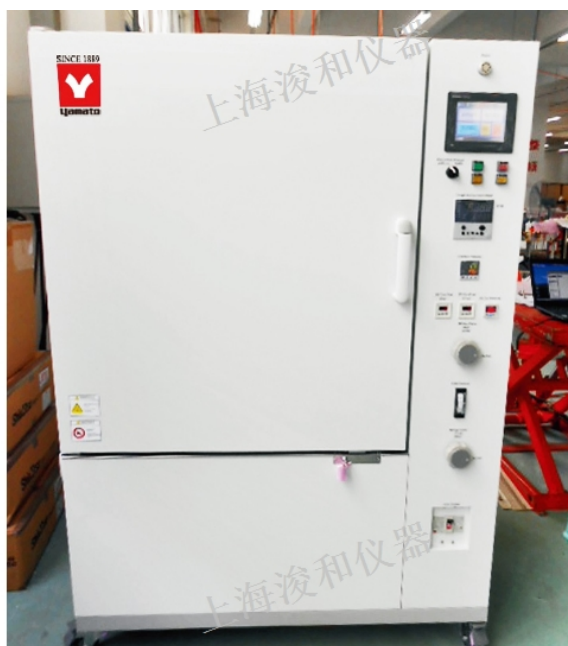
DNN630C厌氧高温气氛炉 相关参数及规格 YAMATO